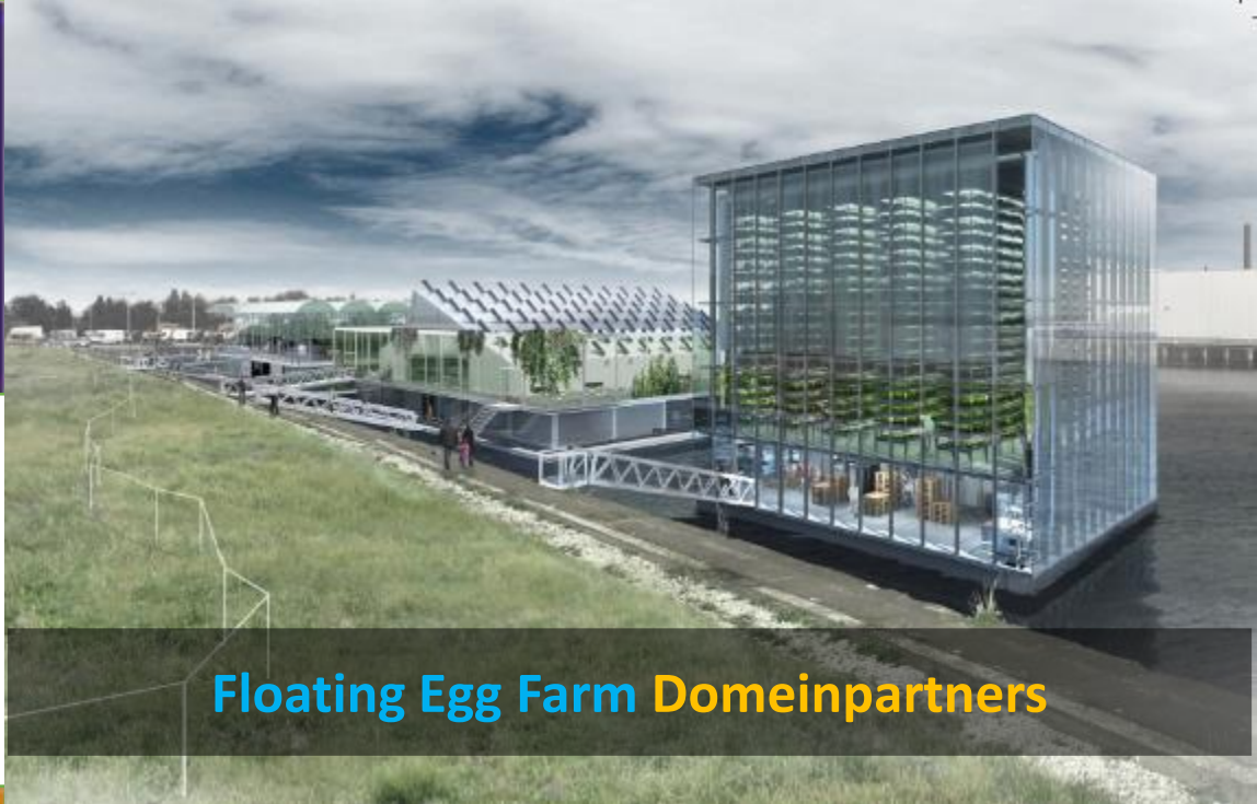
Floating Egg Farm Domeinpartners