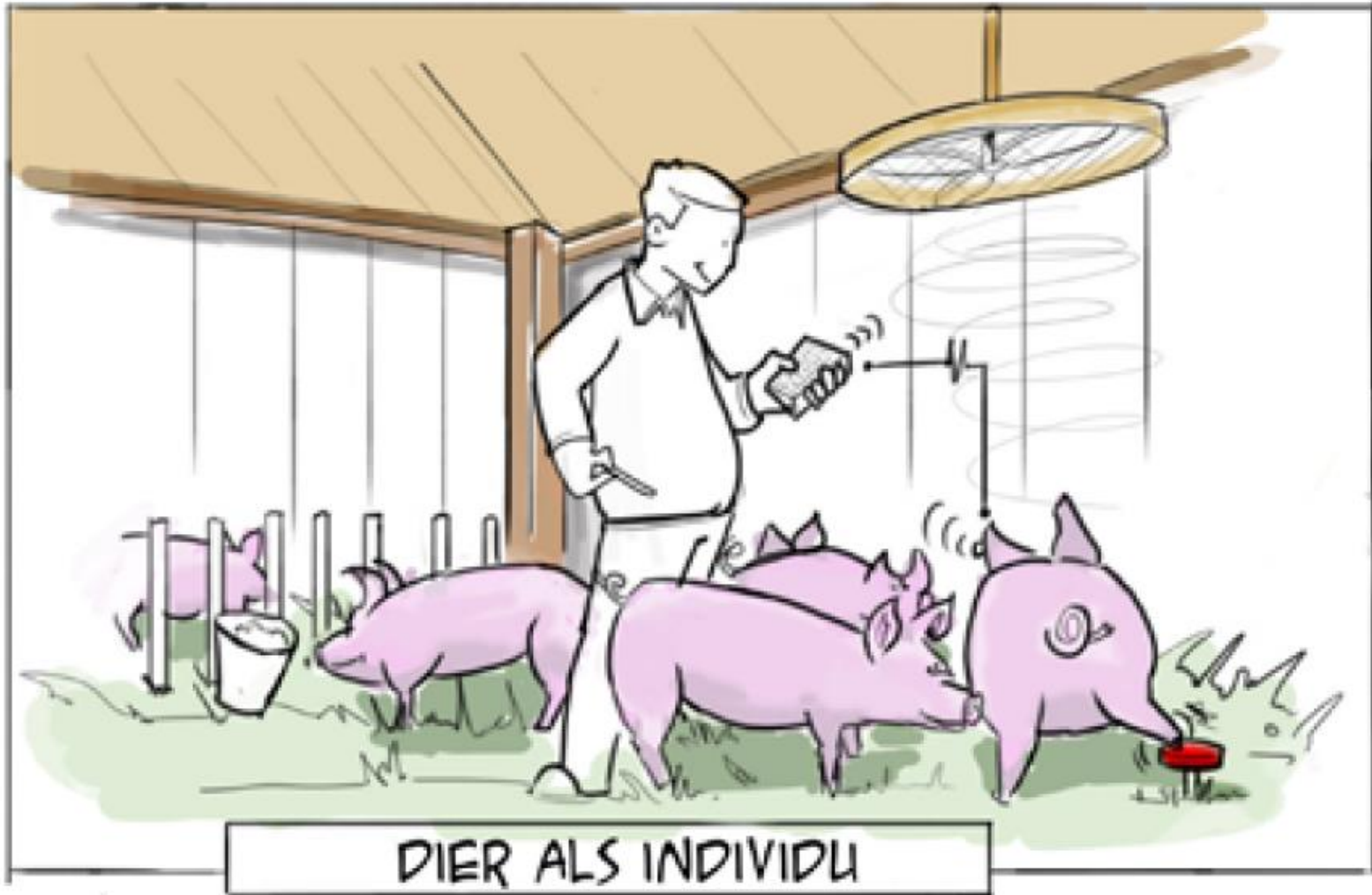
DIER ALS INDIVIDU